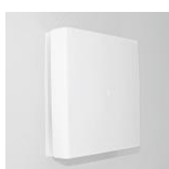
Plastové vnitřní kryty s filtrem - volitelné