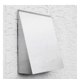
Nerezový venkovní kryt – úprava RAL v barvě fasády za příplatek