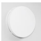
Plastové vnitřní kryty s filtrem - volitelné