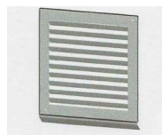
Nerezový venkovní kryt