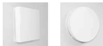
Plastové vnitřní kryty s filtrem - volitelné